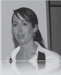
R. Binnema 1 , A. van der Wal 1 , C. Visser 1 , R. Schepp 2 , L. Jekel 3 en P. Schröder

1 EKP, Afdeling Extra-corporale Circulatie, 2 Cardio-anesthesioloog, Afdeling Cardiothoracale Anesthesie, 3 Cardiothoracaal chirurg, Afdeling Cardiothoracale Chirurgie, Medisch Centrum Leeuwarden